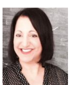
Fatiha BENABDELKADER Lens