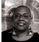
France MOUSTACHE Pointe à Pitre